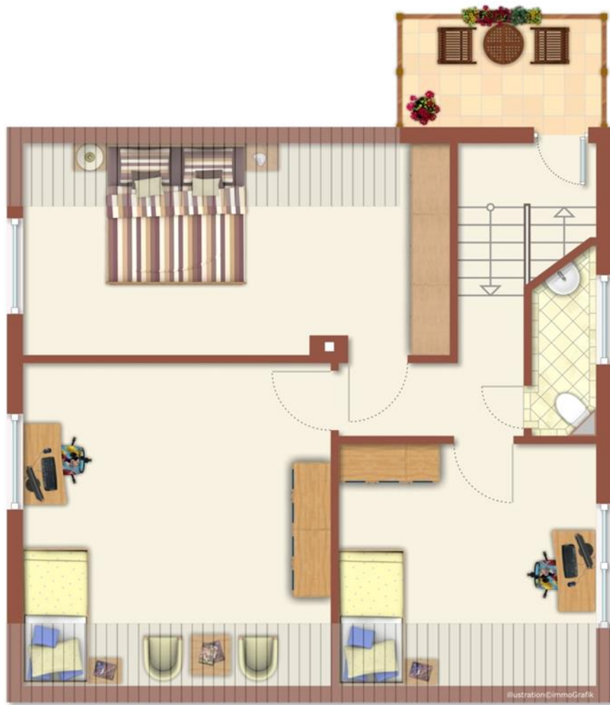
Illustration © ImmoGrafik